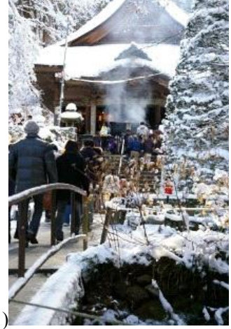
(زيارة المعابد في أول أيام العام الجديد)

日本語 For Japanese press here اللغة اليابانية اضغط هنا 英語 For English press here للغة الانجليزية اضغط هنا