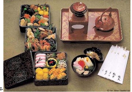
على اليمين صورة طعام (أوزوني) وعلى اليسار(أوسيتشي ريوري)

ويطلق على يوم 2 يناير يوم بداية الكتابة بالحبر (كان من قبل تحضير الريشة والحجر والحبر للكتابة أمر مرهق) حيث كان هذا اليوم في الماضي يوم كتابة بطاقات المعايدة بمناسبة العام الجديد. ومؤخرًا أصبح هذا اليوم هو اليوم الذي يمارس فيه الأطفال والمتقنين فن الخط الياباني للمرة الأولى في كل عام جديد .