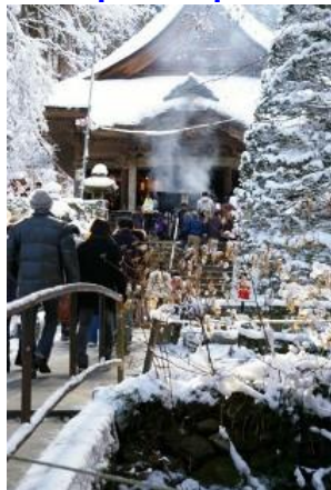
(First shrine visit of the New Year)

For Japanese press here 日本語 للغة اليابانية اضغط هنا