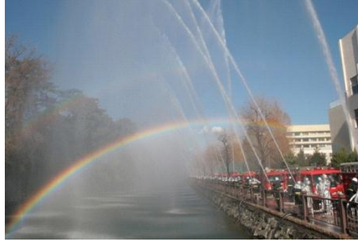
(ديزومي شيكي) عرض رجال الإطفاء

تتركز الكثير من الاحتفالات في فترة الخريف التي تلي فترة جمع المحاصيل وفترة الشتاء التي لا يمكن بها الزراعة حيث كان المزارعين في اليابان قديمًا هم الأغلبية وكانوا يقومون بأعمال مؤقتة في تلك الفترة ويحتفلون بالعديد من الأعياد.