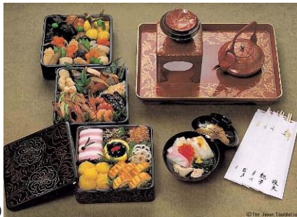
おせち料理(左)と雑煮(右)

1日から3日までは年頭のお休みとなり、人々は家族や友達と初詣(冒頭の写真参照)*に出かけたり、親戚の家や上司の家へ(今年もよろしくという)年始の挨拶に出かけたりします。年頭の最初の1週間は殆ど家事をしなくてもいいように、おせち料理と言う名のお正月独特の縁起を担いだ保存食に近い料理を年末に準備します。それぞれの家族や地方で受け継がれてきた料理があるので、このおせち料理も、もう一つの正月料理、お雑煮も、隣の家とはまったく違う素材や味付けであったりします。子供たちも年末年始は冬休みになりますが(12月27日~1月7日くらい)、年頭に『お年玉』というお小遣いを両親や親戚からもらいます。2日は筆初め(昔は筆と硯と墨を出してもものを書く準備も大変だった)といわれ、昔は年賀状を書いた日だったそうですが、最近では子供たちや文化人の書初めの日になっています。