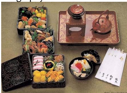
Osechi-ryori (Left) and Ozoni (Right)

2 nd January is "Fude Hajime" (long ago preparing a writing brush and an ink stone to write something was a difficult job), since people used to write New year's greeting cards on this day in the past, but nowadays it is the day when people of culture and children write special calligraphy for the New Year.