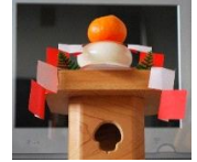
(كاجامي موتشي) كعكة الأرز الكبيرة

وفي وقتنا الحاضر الثلاثة أيام الأولى من العام إجازة لدى الجميع. لذا فمعظم المحلات تكون مغلقة تمامًا باستثناء بعض المتاجر التي تعمل طوال ال 24 ساعة والمراكز التجارية. أما المطاعم والمنتزهات فتكون مزدحمة بالعائلات. وهذا بالطبع يشبه كثيرًا احتفالاتكم في الشرق الأوسط بأعياد الميلاد (كريسماس) وعيد الأضحى وغيرها .. من حيث زيارة الأقارب والذهاب مع العائلة والأصدقاء للمنتزهات والحدايق والاستمتاع بالتسوق وغيره .